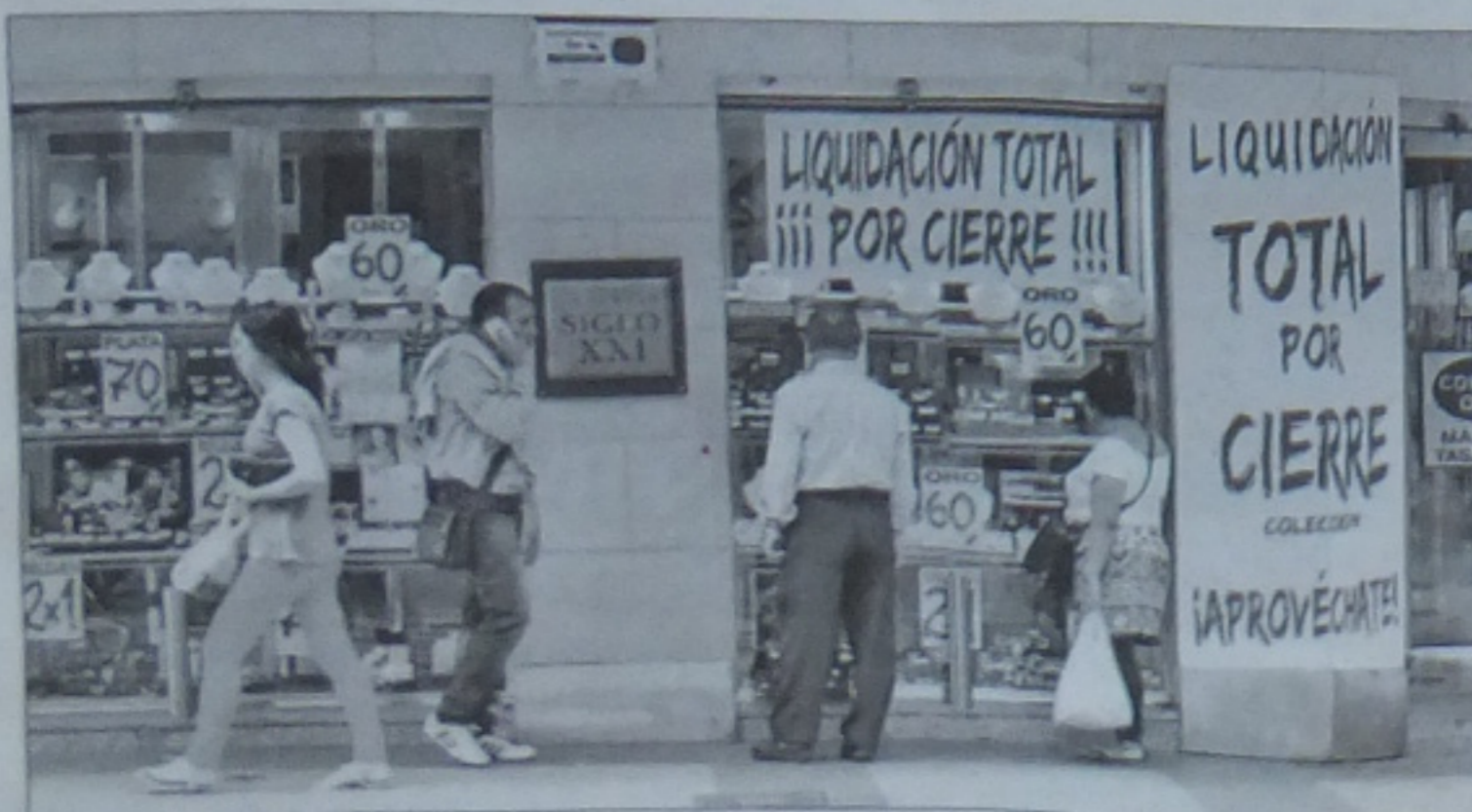
Bastantes negocios del centro hacen liquidación por cierre. M. GUILLÉN

Pero no todas las previsiones son malas, se encarga de decir el presidente de los promotores. «En Murcia notamos cierto movimiento en el sector sanitario, que parece tirar del carro en estos tiempos». Así, se proyecta la construcción de un nuevo hospital en el entorno de las avenidas Juan Carlos I y Juan de Borbón y hay varias clínicas que también se espera que se instalen próximamente en la ciudad. «El sanitario, por lo tanto, es un sector que da un paso adelante y se posiciona ante la crisis», señala.